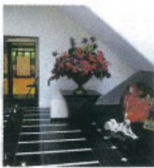
▲玄関からは別世界へ! 日常を忘れて楽しんでください