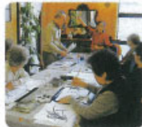
▲はじめての水墨画も深みのある一つになりました