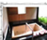
朝の集(ソラウム集)