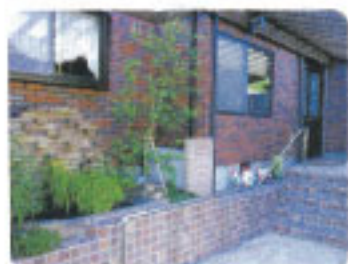
▲玄関を通ったときから気分は旅行(★☆☆)♪