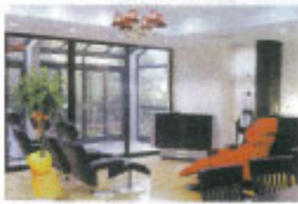
▲大型TVとゆったりくつろげるソファのあるリビング空間