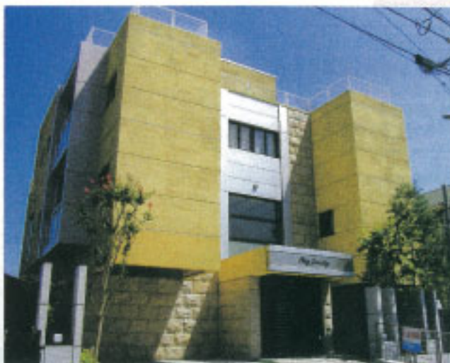
▲上田恵亮デイサービス田原新町です