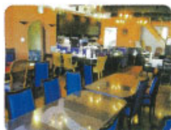
▲広々とした別荘気分のリビングでくつろげます