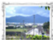
ベランダからの 皆様手元の眺め