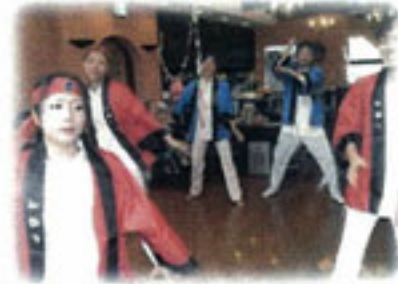
スタッフによるソーラン節