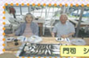
門司 シートレビアン