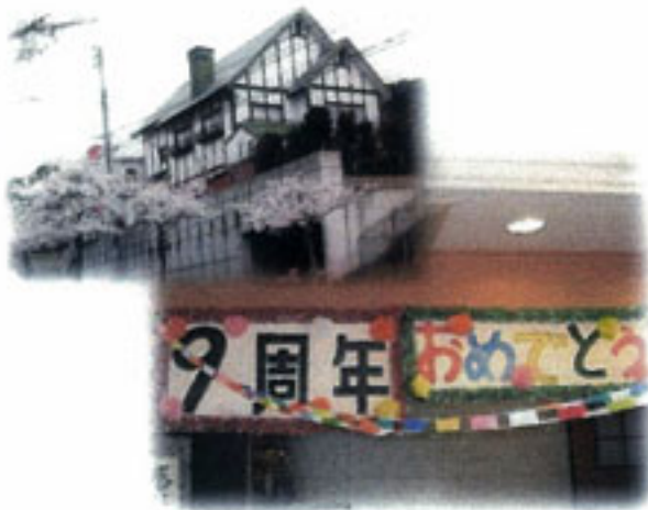
利用者様と一緒に作った飾りとお神輿

これからもみなさんと一緒に楽しい毎日をご過ごしていけるように頑張っていきたいと思っております！