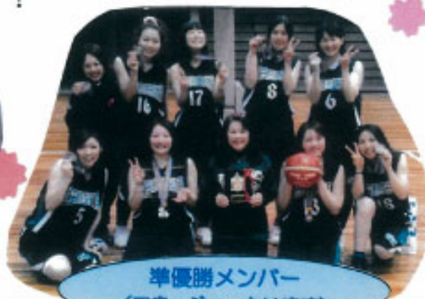
準優勝メンバー (マネージャーもいます)