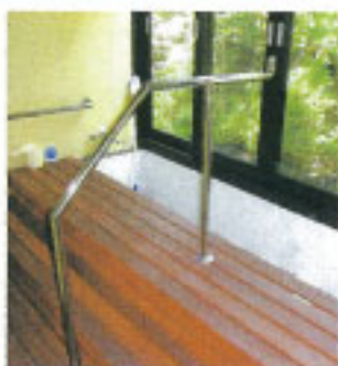
▲お出かけあとは足湯で疲れをとります