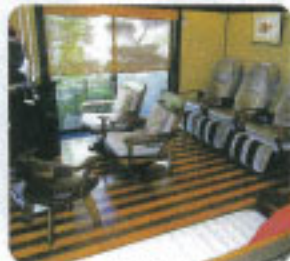
▲ここで絵手紙や水墨画、体操など楽しめます