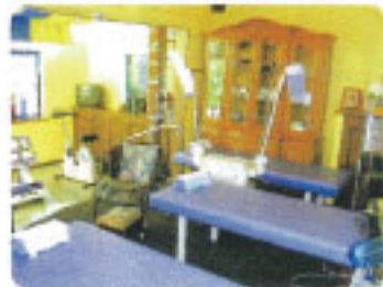
▲リハビリ(機能回復)の機器も充実しています