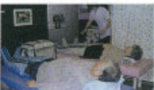
▲足のむくみもとれて元気に(*^^*)