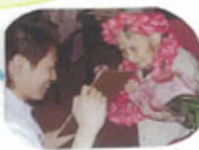
お友達と「はいチーズ」