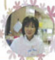
看護主任 手寫由起子

当時はスタッフ10数名しかいませんでしたが、現在は50数名で運動会が出来るほどです。私事では、中学生だった娘も社会人になり、私も検診の結果を心配する年齢になりました。後10年を目標に頑張っていきます。