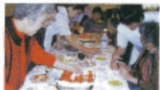
▲おいしいケーキ作り 笑顔がたえません