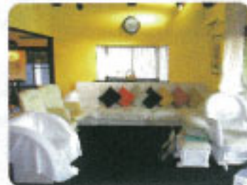
▲くつろぎ(マッサージチェアなど)空間