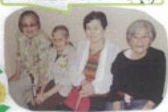
リハビリも頑張っています！！