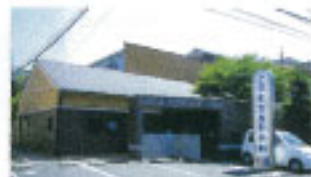
▲通所リハビリテーションセンターです