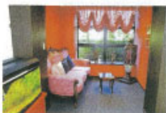
▲玄関先の待合室も素敵な空間を演出しています