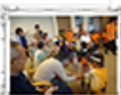
ご利用者様の交流