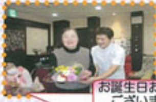
お誕生日おめでとうございます!!